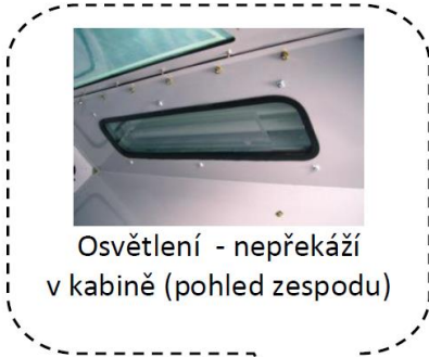
Osvětlení - nepřekáží v kabině (pohled zespodu)