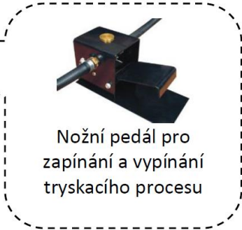
Nožní pedál pro zapínání a vypínání tryskacího procesu