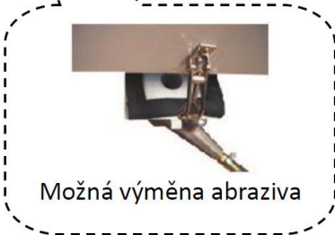
Možná výměna abraziva