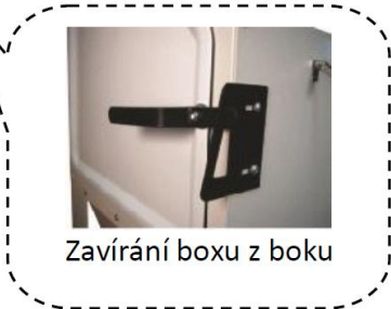
Zavírání boxu z boku