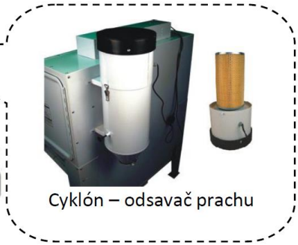
Cyklón – odsavač prachu