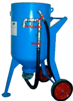
piskovačka W 1/200 F