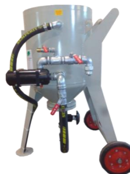
piskovačka W 1/100 PRSC

*jako bonus v ceně zařízení, výběr barvy a stylu písma dle nabídky, max. délka 600mm, možnost foliopísma (více-barevné) nebo nástřiku barvou (jedno-barevné)