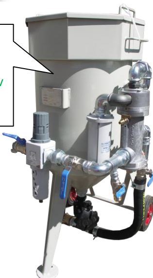
piskovačka W 1/40 PRFD - automat (piskovačka W 1/40 S – polo-automat) S regulátorem a odkalovačem

zde místo pro vaše firemní logo, název nebo značku*