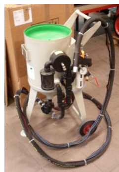
Pískovačka W 1/25 kompletní řídicí ústrojí