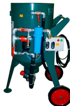
piskovačka W 1/100