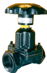
SA-kohoutový ventil směšovače abraziva