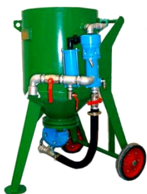
piskovačka W 1/100 PRFD