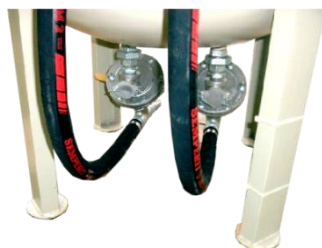
piskovačka pro obsluhu dvou pracovníků L 2/500 F s dvěma výstupy na tryskání FSV-

*jako bonus v ceně zařízení, výběr barvy a stylu písma dle nabídky, max. délka 600mm, možnost foliopísma (více-barevné) nebo nástřiku barvou (jedno-barevné)