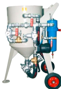
piskovačka W 1/40 PHBTALX s přidaným AGZ separátorem vlhkosti