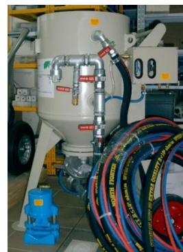
Pozn.: ilustrační foto