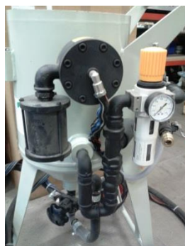
Pískovačka W 1/25 kompletní řídicí ústrojí