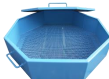
Síto + víko