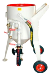
piskovačka W 1/25-40 S