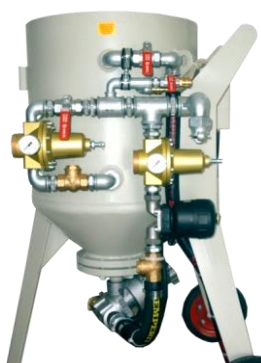
piskovačka W 1/200 EHTA